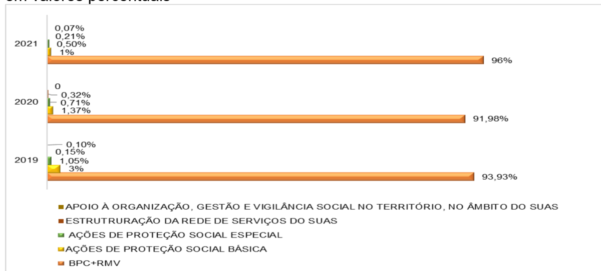
Gráfico 2 Participação do BPC e dos serviços socioassistenciais no total do FNAS em valores percentuais