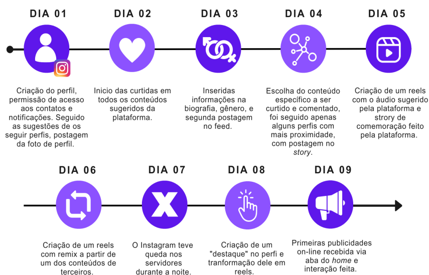
Imagem 1 - Linha do tempo com os dias e ações feitas a cada dia

Assim, somente no primeiro dia (15/05/2023) a plataforma teve um maior foco em indicar ações por meio de notas informativas que surgiam na tela: novos perfis a serem seguidos, publicações em formato de foto ou vídeo, por exemplo. As ações podem ser observadas detalhadamente na Imagem 1.