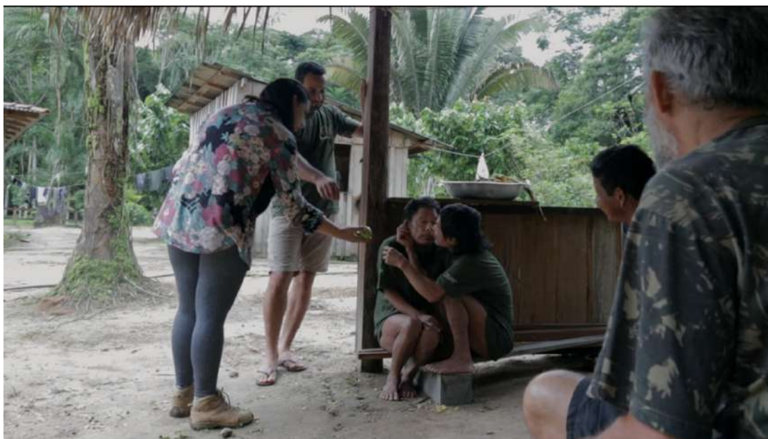
Figura 4 – Print do filme Piripkura