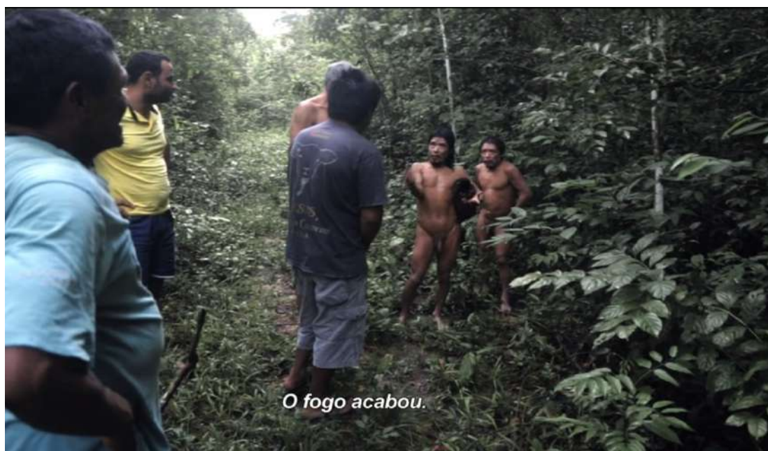
Figura 3 – Print do filme Piripkura

É surpreendente perceber que, mesmo nus, eles se sentem à vontade na floresta, como se a floresta fosse a própria roupa, como é possível observar na imagem abaixo, retirada deste momento descrito. Além disso, impressiona como os piripkuras mantinham uma boa aparência. A imagem lembra o físico de estátuas gregas, como um modelo vivo.