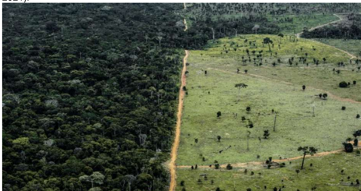
Figura 2 – Fotografia das terras dos povos piripkura

Como mostram as imagens de satélite, nas Figuras 1 e 2, segundo o pesquisador do ISA, Antonio Oviedo, "nos últimos dois anos, o desmatamento verificado dentro da Terra Indígena Piripkura foi 27.000% superior ao registrado nos dois anos anteriores" (ANDRADE, 2021, p.3). Os dados se referem ao biênio 2020/2021, e ,em outubro de 2021, o desmatamento acumulado era de 12.426 hectares, equivalente a mais de sete milhões de árvores derrubadas. (ANDRADE, 2021).